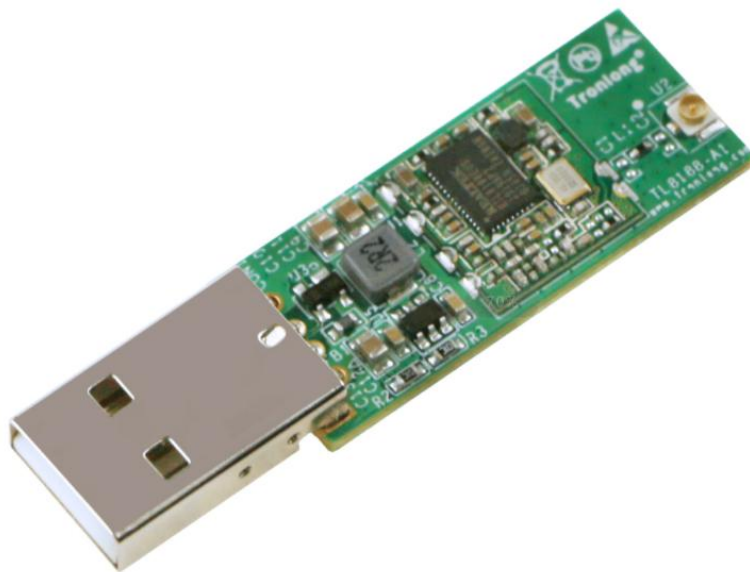
图 2 模块斜视图