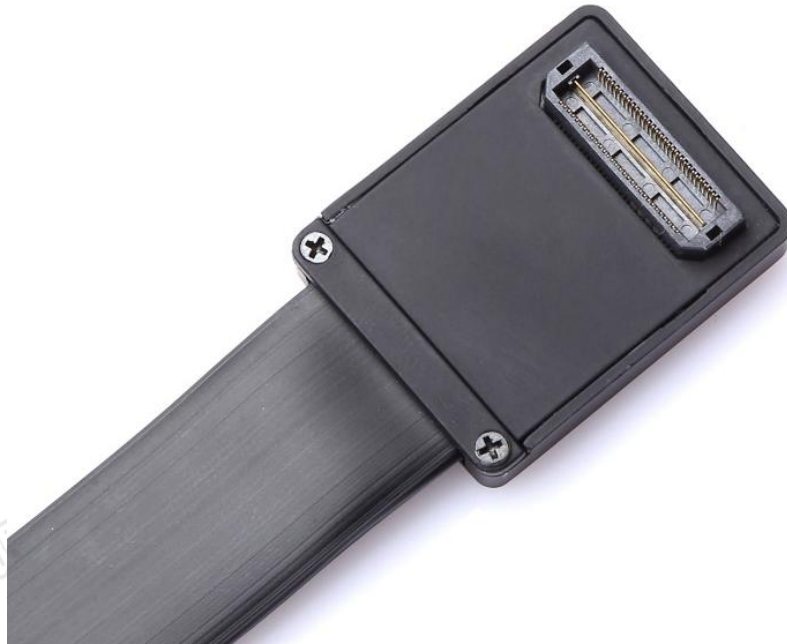
图 3 60pin MIPI 母座接口

TL-XDS560V2 仿真器引出的是 60pin MIPI 母座接口，可通过 20pin/14pin JTAG 转接头连接目标板。20pin/14pin JTAG 转接头引脚位置示意图如下。