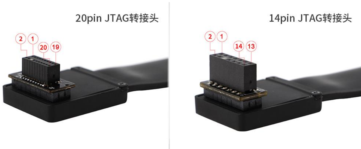
图 4 20pin/14pin JTAG 转接头